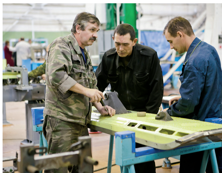
Внедрение современных управленческих технологий, бережливого производства, стимулирование предприятий — амбициозная задача, поставленная президентом страны.

роль с точки зрения реализации региональных программ. Уже имеется целая подборка механизмов дополнительного стимулирования предприятий к повышению производительности труда, стимулированию регионов, которые будут демонстрировать наивысшие показатели