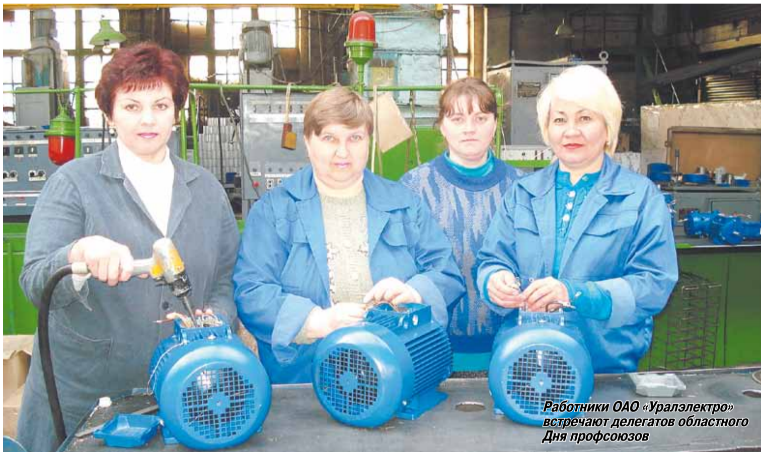
Работники ОАО «Уралэлектро» встречают делегатов областного Дня профсоюзов

Сегодня в городе подведут итоги социального партнерства в трудовых коллективах и деятельности профсоюзных организаций.